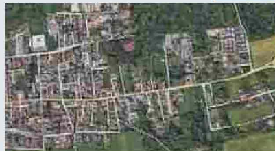
Appartamenti Cogliate Dei Gerani 5